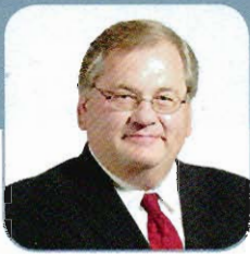
Me LUC AUDET © Luc Audet, avocat, MMVII